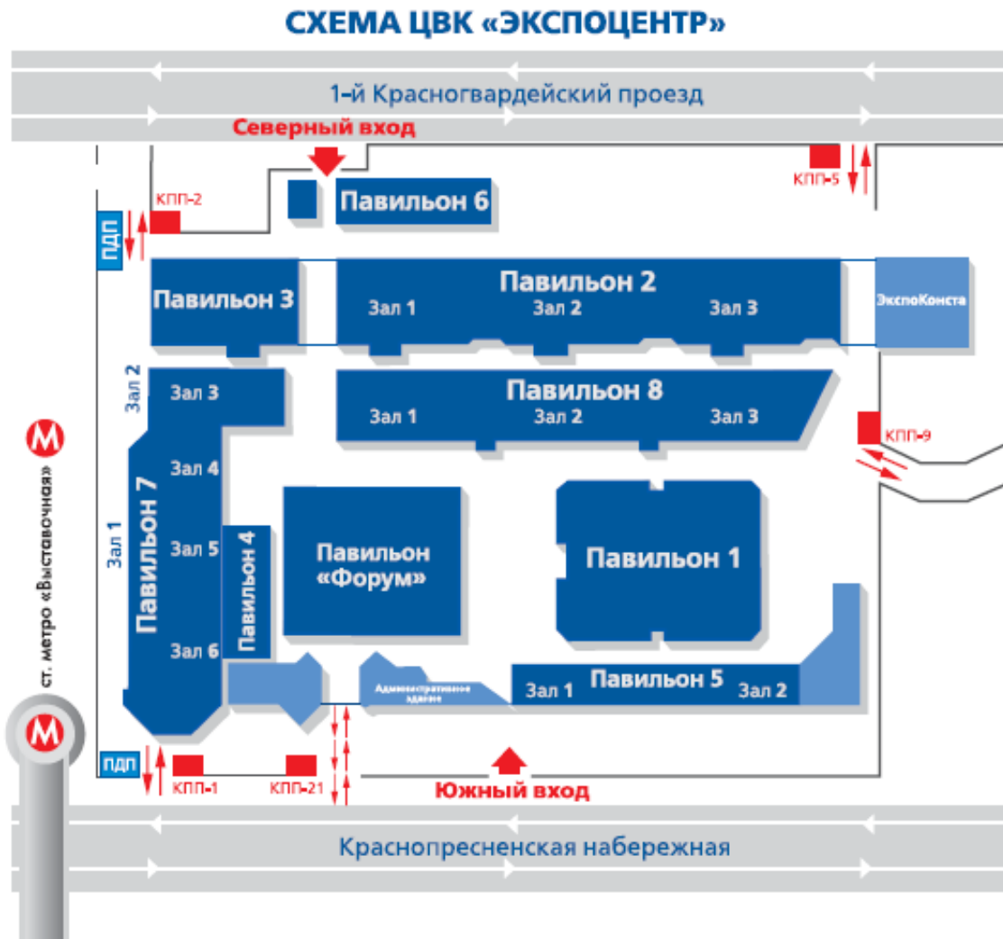
Схема расположения Контрольно-пропускных пунктов (КПП) на ЦВК «ЭКСПОЦЕНТР»